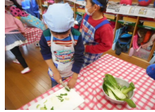
みそ 汁 作 り